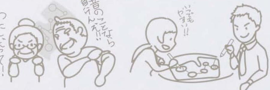
昔の地域をめぐる歴史マップシート あなただけの地域すごろくをつくれる

シートボードにかぶせることで違った角度からの地域を見つめ、あそぶことができます。