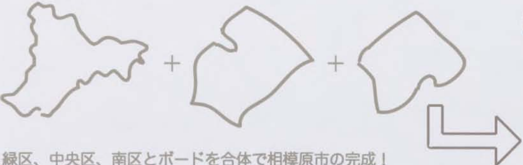
緑区、中央区、南区とボードを合体で相模原市の完成!

シートボードにかぶせることで違った角度からの地域を見つめ、あそぶことができます。