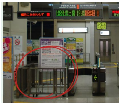
↳ 団体さんの通る手動改札

※朝の通勤ラッシュや通学ラッシュの(7時半～9時)に改札で引っかかってしまうおそれが、高いのでこの時間帯は、団体さんが通る手動の改札に駅員さんに立ってもらって定期や切符などは昭和の確認の仕方で通ってもらう！