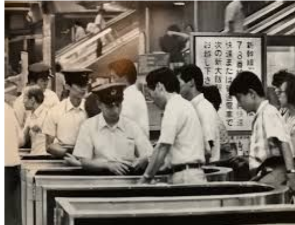
↳ 昭和の改札の仕方